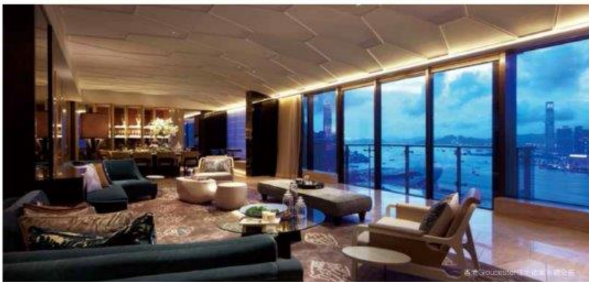
香港 Gloucester Hotel 室內設計

以香港為總部，曼谷是第一分支辦公室，於2014成立的台北辦公室則是奧必設計在亞洲的新生力軍。全員超過70人，由來自12個不同國家所組成的設計團隊，藉由顏學添與伍仲匡帶領，監督建築進展的每一階段，細心編織空間每一輪故事的情節與對話，確保所計劃的設計形式與細節都能到達且超越所預計的完成度與品質。奧必設計所推崇的設計哲學是：「我們為客戶所設計的每一個案子都應能夠永久流傳。我們只選擇且專心致力於能引起我們熱情的案子，因為唯有這樣的案子才能激起我們的情感與共同的想像力，擁有了這樣的基礎，我們便開始撰寫故事與創造設計概念，點綴鋪陳空間的枝節，進而創造實際的空間氛圍及印象。」這次我們將介紹一系列奧必設計的代表性作品，用以激發人們對設計的理想與潛力。