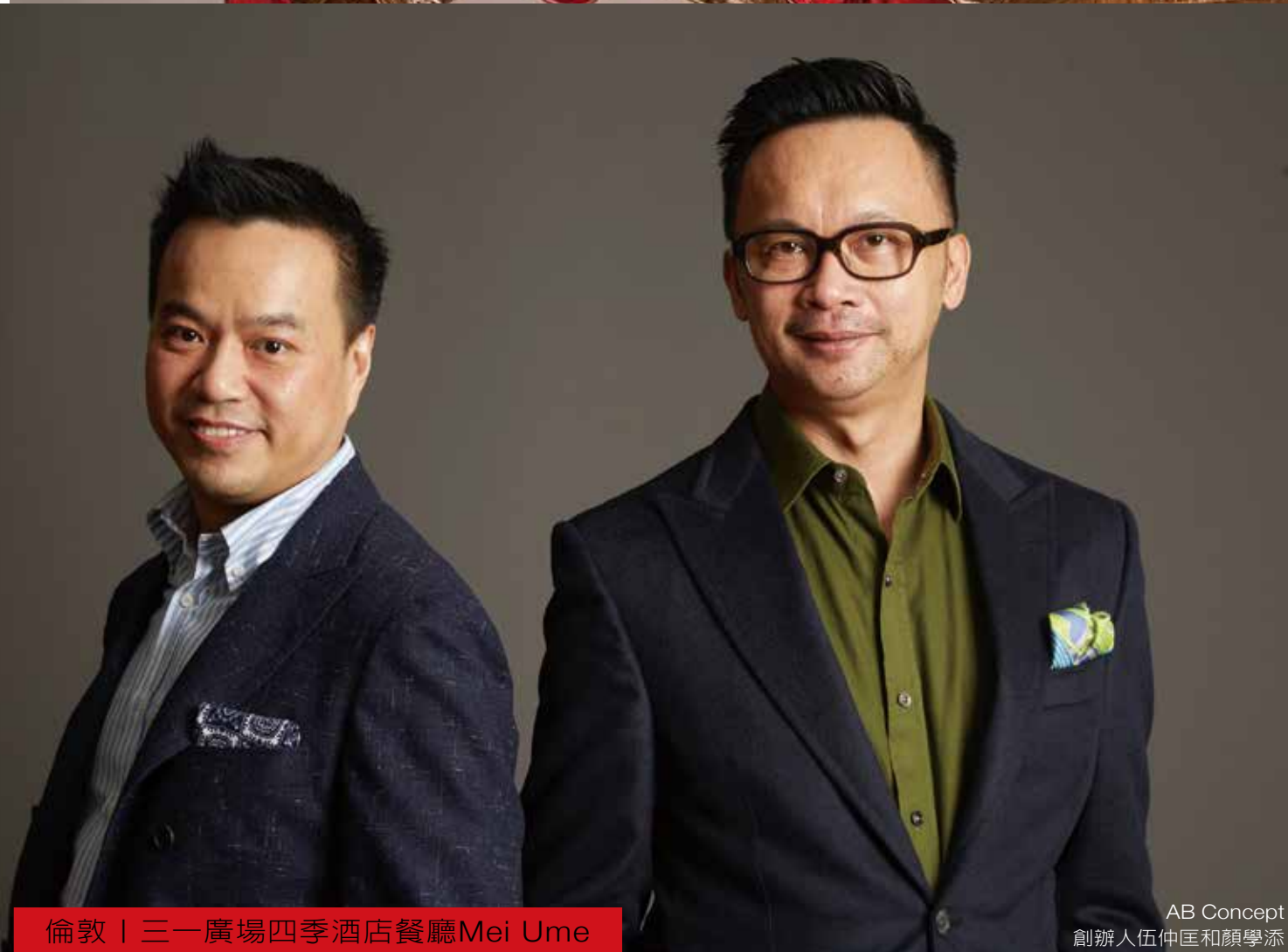
倫敦 | 三一廣場四季酒店餐廳 Mei Ume