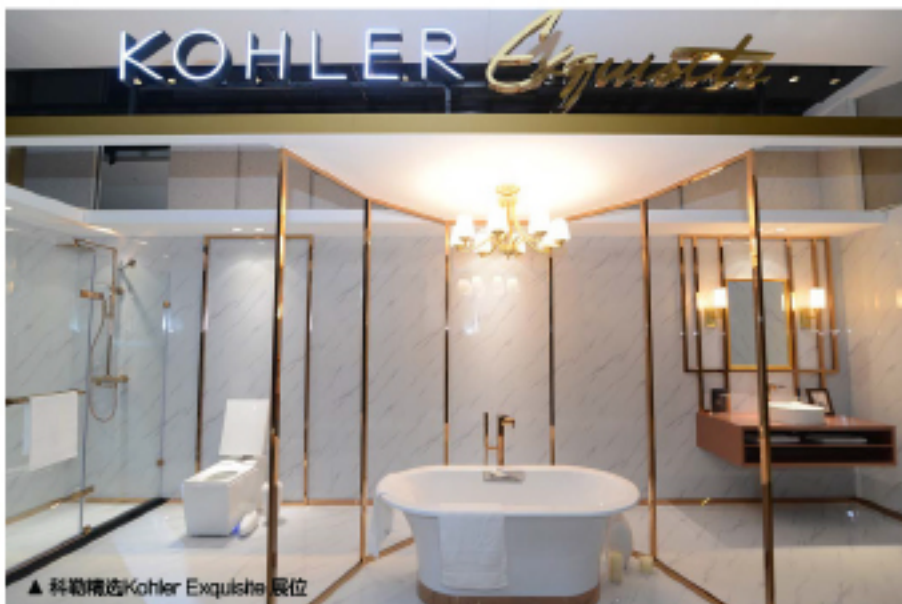
▲ 科勒精选 Kohler Exquisite 展位

《ELLE1DECORATION家居廊》携手北京设计周及战略合作伙伴科勒 KOHLER，并联合ZYMBIOZ齐柏林和三里屯CHAO举办的2017北京设计周亚太设计论坛“精进·设计中的变革”，于近日在三里屯CHAO花园大厅完美落幕。