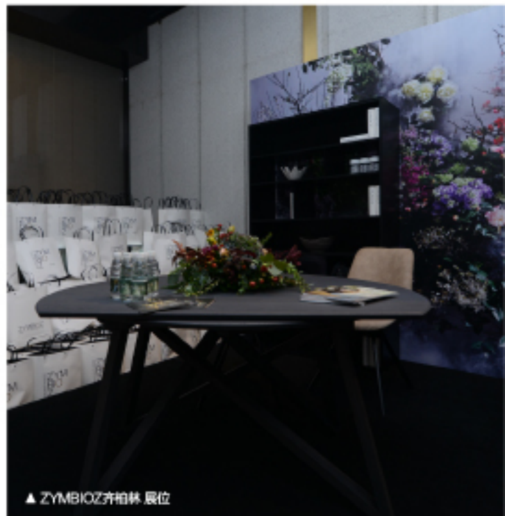
▲ ZYMBIOZ齐柏林 展位

顶尖产品系列“科勒精选”由科勒全球设计师通力合作，在全球范围内甄选原材料，经由资深工匠不惜时间成本的手工打磨铸造，以百年工艺为底蕴，用绝不妥协的设计语言，让优雅生活焕发了精致生活美学的魅力。